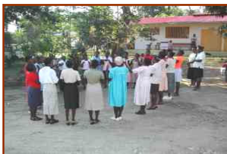
Formation des monitrices du préscolaire