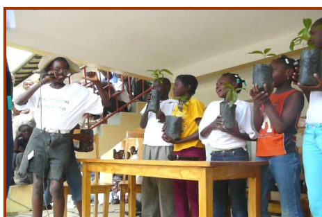
Fête de l'arbre