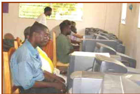
Formation multimédia des enseignants

De 2001 à 2006, des activités importantes ont été mises en place. Les équipes d'ID et les populations se sont mobilisées pour améliorer la qualité de l'éducation des enfants.