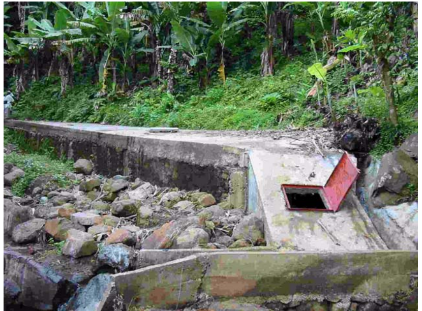
Captage de Haboungou, Anjouan

EP : Ils sont trop nombreux pour les citer tous.