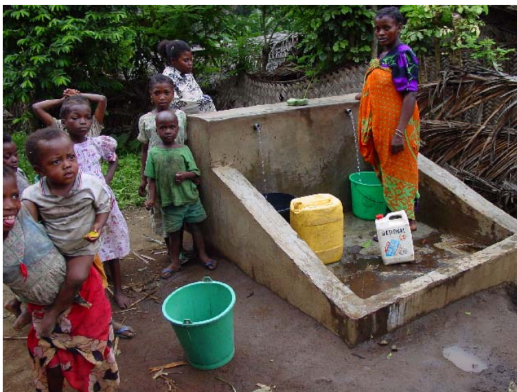
Borne Fontaine dans un village d'Anjouan

- Assister dans la même journée à une conférence « Water and Governance » où 9 intervenants sur 10 sont américains et bla-blatent de démocratie autour de l'eau et ce au début de la guerre en Irak. Cette